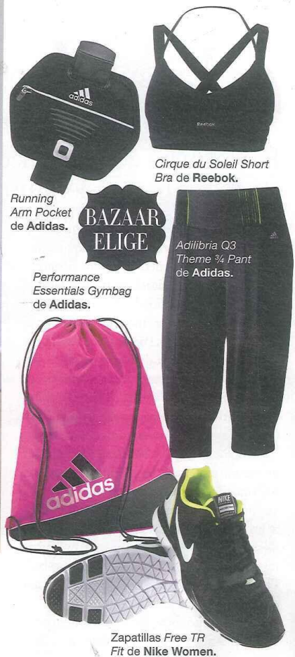
Running Arm Pocket de Adidas.

Para hacerse una idea, este método se basa en una combinación de bailes —desde el tango y la samba hasta hip-hop — que van cambiando de intensidad y velocidad para evitar que la sesión resulte repetitiva. Esta mezcla explosiva, junto con un profesor acreditado y ritmos pegadizos, permite fortalecer los músculos, hacer que pierdas grasas y hasta mil calorías por sesión.